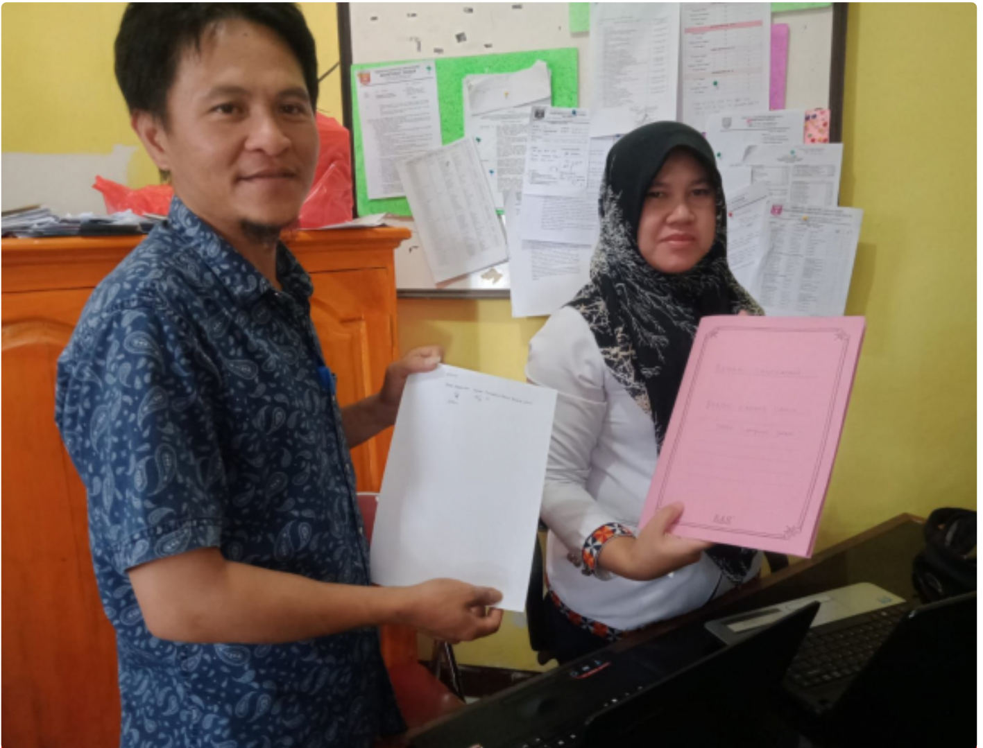
Aparatur pekon padang cahya